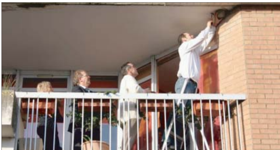
La pose de nichoirs pour hirondelles a eu lieu vendredi après-midi dans la résidence Touraine.

L'initiative de la pose de nichoirs a été permise par la coopération entre Naturalistes Sans Frontière et les différents bailleurs sociaux, Habitat 62/59 Picardie (pour la résidence Touraine), l'OPH et Logis 62 (pour des projets ultérieurs).